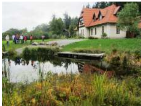
(Vzd lávací za ízení Lipka)

Akci podpo il Jihomoravský kraj a Nadace m sta Letovice.