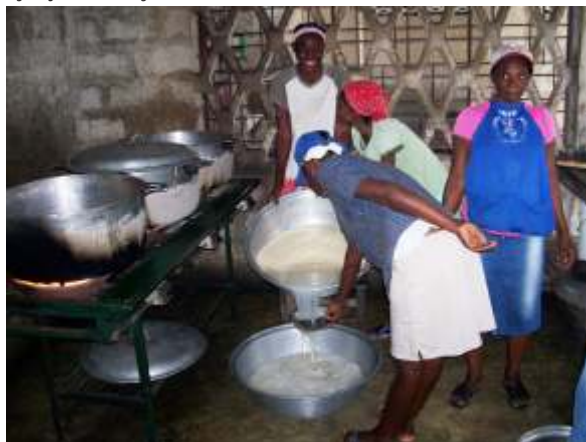
(Školní kuchyn na Haiti)