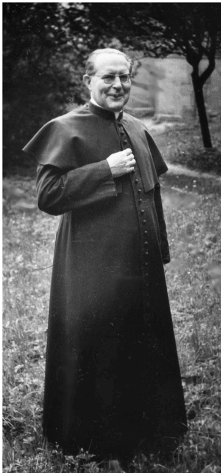
(Úvodní text a foto: Bohumil Kocina)