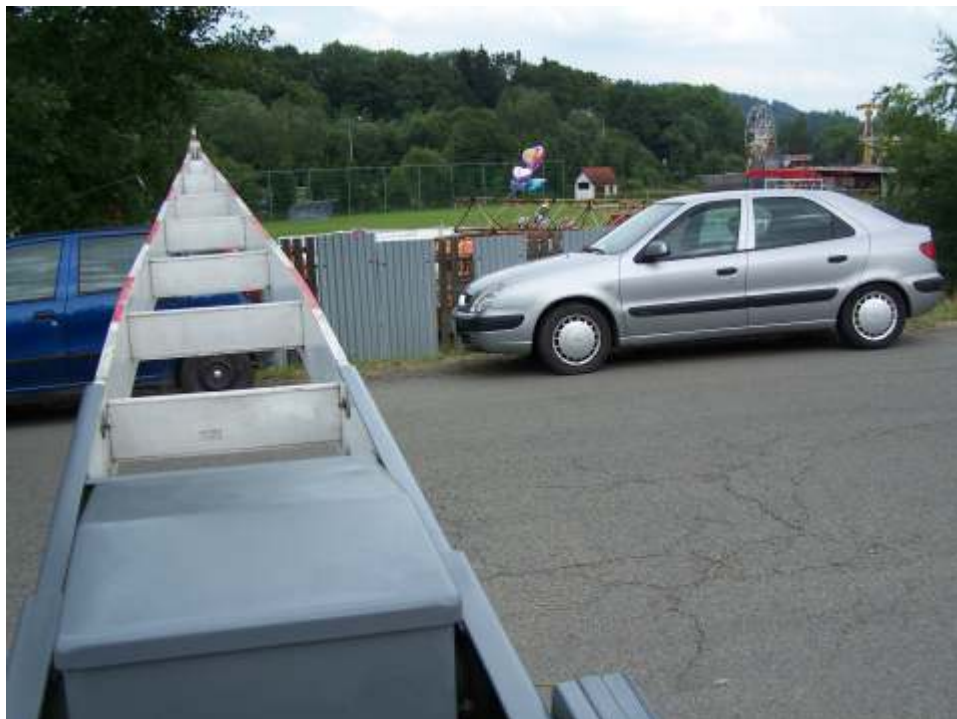
(Snímek z letošní pouti, kdy vozidla parkovala i na přejezdu, do tmavého vozidla narážela závora.)