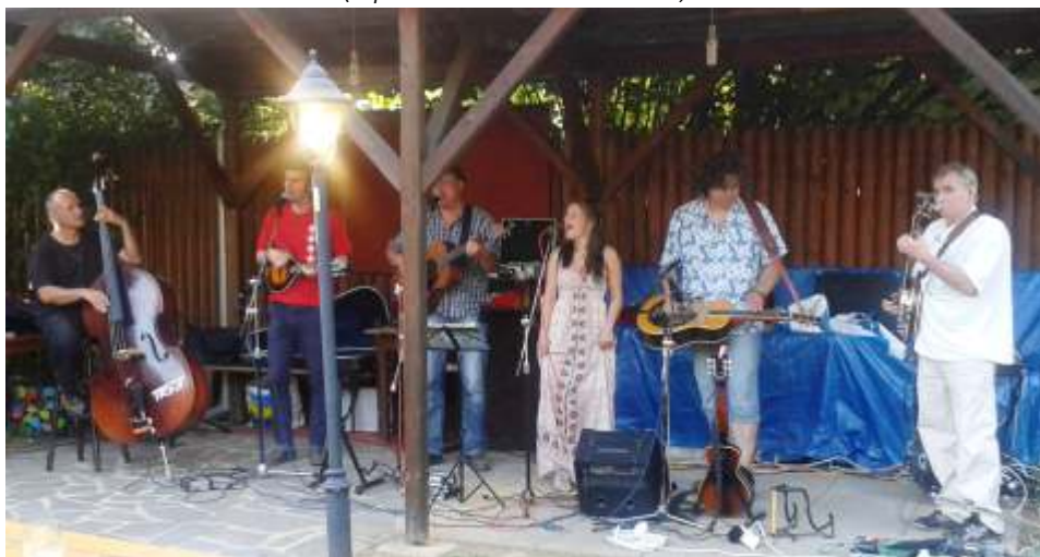
(Boskovická country skupina Trní)