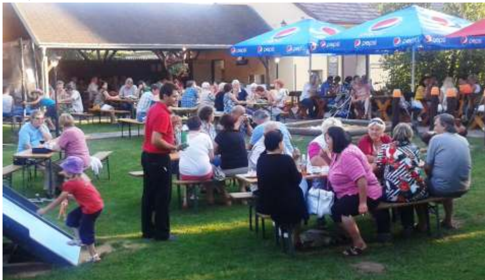
(Zapláněná zahrada hotelu Dermot)