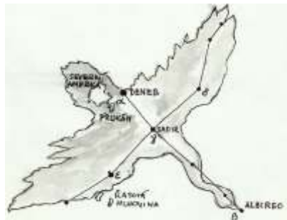
SOUHVA ZDI LABUT

Závěrem několik úkazů na obloze: 1. 10. nastane konjunkce Měsíce a Marsu. 25. 10. ve večerní době viditelná konjunkce Měsíce s Jupiterem. Další konjunkce Měsíce s Marsem proběhne 29. 10., Mars v blízkosti Měsíce uvidíme 30. 10. ráno nad východním obzorem. 21. 10. můžeme pozorovat maximum meteorického roje Orionid. -Ch-