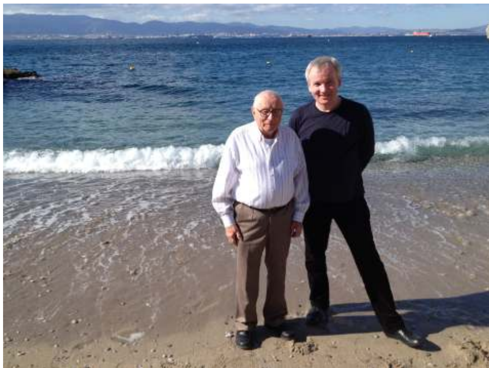
(Milosrdní bratři ve Španělsku)