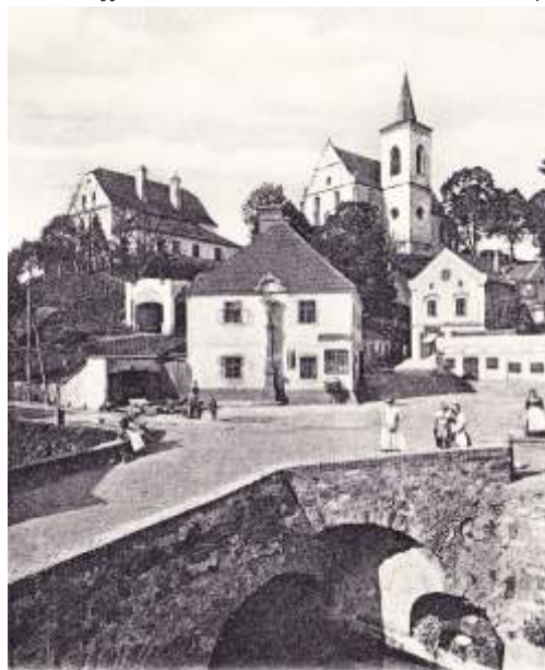
Letovice, Fární chrám.

Jistý automobilista vezl náklad 35 metrák hrušek do kopce k zámku. Asi 5 metr p ed vrcholem kopce auto nevyjelo a za alo couvat. Šofér sto il auto nap í silnice v místech nad k ížkem. V z se p evrhl a všechny hrušky se rozkutálely z kopce dol .